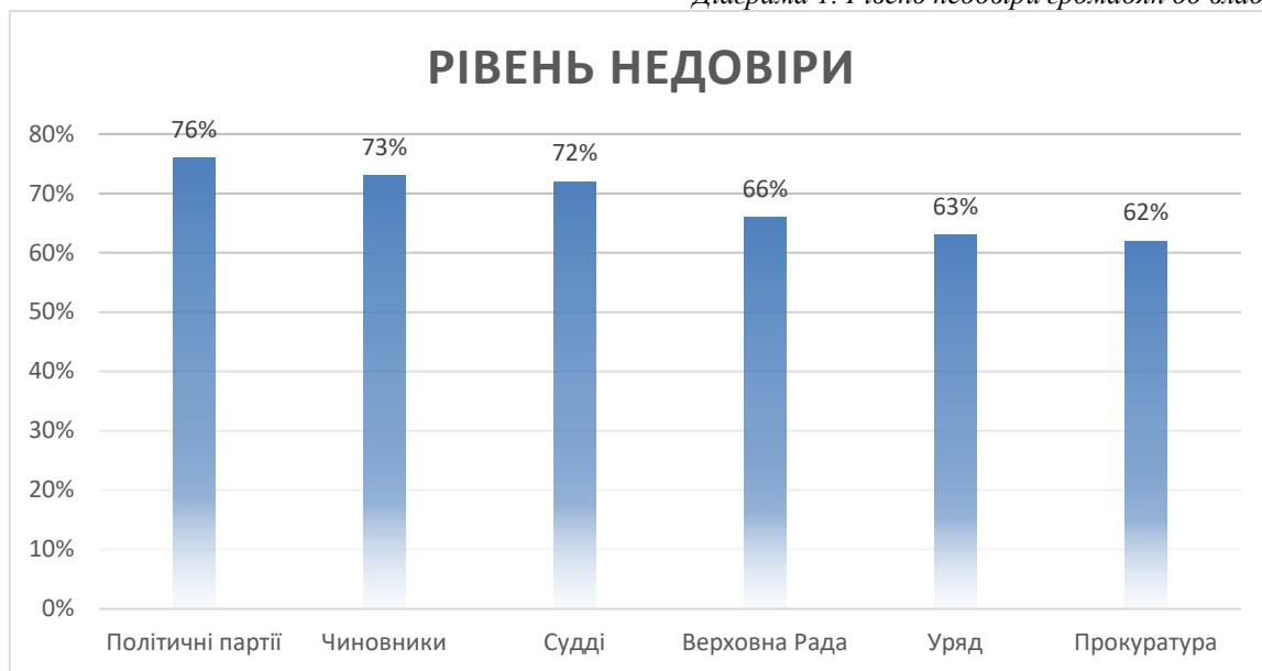
Діаграма 1. Рівень недовіри громадян до влади