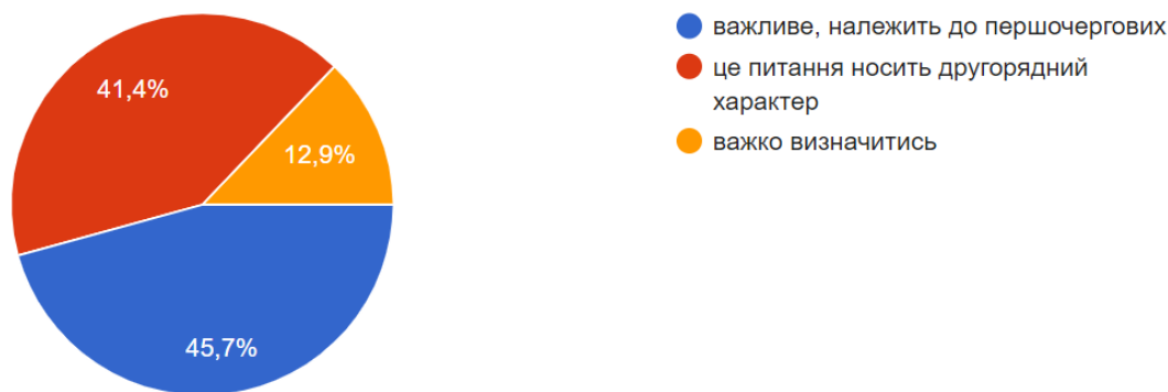
Рис. 1. Важливість питання щодо використання ШІ в навчальному процесі

Серед сервісів штучного інтелекту домінує ChatGPT, ним користуються майже всі опитані – 92,9 %, друге місце – Grammarly 37,1 %, третє місце поділяють та Midjourney – 31 %, також респонденти виділили DALL-E, Bing AI, Mathway, лише 5,7 % опитаних не користуються жодним сервісом (див. рис.2).