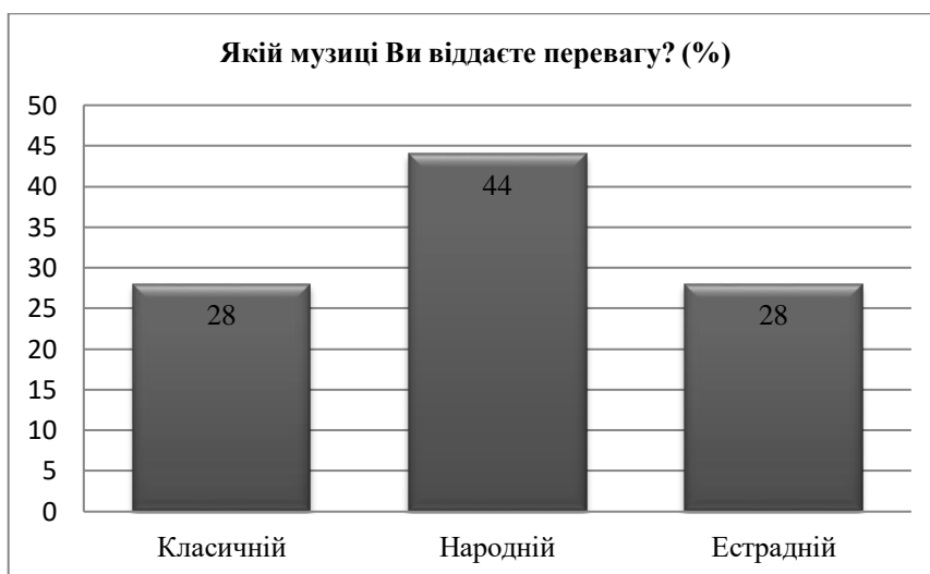
Рис. 4.2. Музичні вподобання досліджуваних

На питання «Записи якої музики є у Вашій фонотеці?» відповіді респондентів розподілилися таким чином: народна музика – 48%, естрадна – 34%, класична – 18% (див. рис. 4.2).