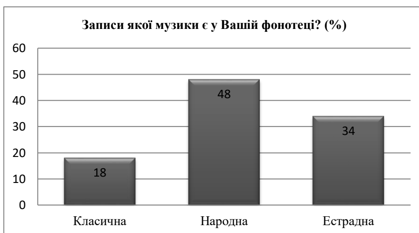
Рис. 4.3. Аналіз порівняння музичних вподобань досліджуваних

Загалом отримані результати з цієї позиції, на нашу думку, є цілком закономірними, оскільки корелюються з результатами відповідей на попереднє запитання про переваги у музичних вподобаннях. Проте, не є достатніми в аспекті розвитку музичної культури досліджуваних засобами українського фольклору.