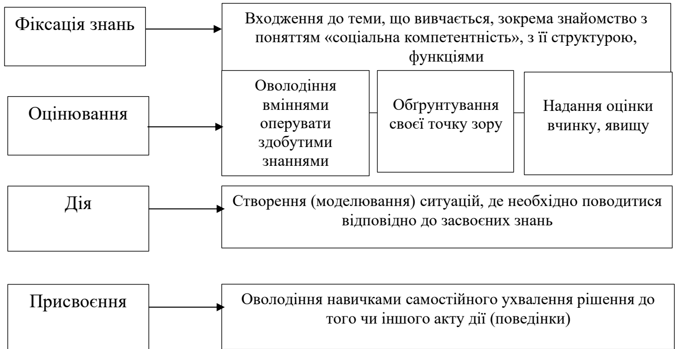
Рис. 1.1. Стадії процесу розвитку соціальної компетентності молоді

Зауважимо, що при розробці стадій процесу розвитку соціальної компетентності молоді ми спиралися на науковий підхід щодо аксіологічних проблем становлення особистості.