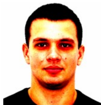
Неприродний колір шкіри та/або відблиск на обличчі