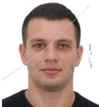
Зі слідами чорнила, зламами