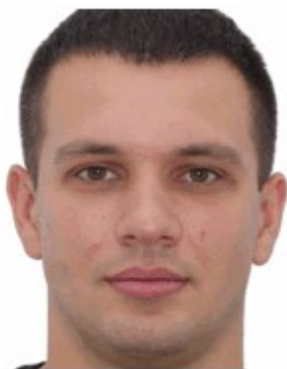
Кадрування більше ніж 80 %